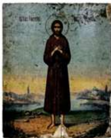
Блж. Прокопий Вятский. Кон. XIX – нач. XX в. (Кировский обл. краеведческий музей)

ПРОКОПИЙ (Плишков (Плушков, Плириков); 1578, дер. Корякинская (или Митино) близ г. Хлынова (Вятки, ныне Киров) – 21.12.1627/