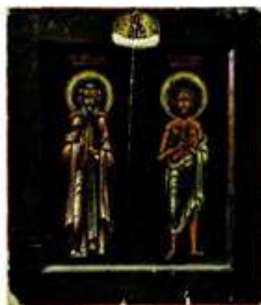
Прп. Трифон и блж. Прокопий Вятские. Икона. Кон. XIX — нач. XX в. Мстера (Кировский обл. краеведческий музей)

хранилась в Успенском соборе Трифонова мон-ря (Трехсотлетие. 1912. С. 6). В основном это традиц. пядницы с образом святого на фоне обители. На ико-