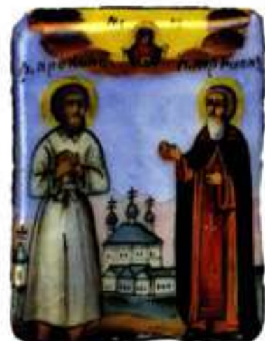
Блж. Прокопий и прп. Трифон Вятские. Эмалева икона. Кон. XIX — нач. XX в. (ЦМиАР)

Монументальные изображения П. (плохой сохранности либо под записью) встречаются в исторических границах Вятской епархии. В настенной живописи, в силу ее специфической связи с архитектурой и традиц. распределения сюжетов в пространственных зонах храма, появились самостоятельные образы первых вятских святых. В теплой (трапезной) части храмов для таких композиций отводились межколонные пространства юж. стены (напр., в Троицкой ц. с. Кстинина, Кирово-Чепецкий р-н Кировской обл.), южной ярус зап. стены (кон. XIX — нач. XX в., Троицкая ц. с. Волкова), зап. столпы (напр., сев.-зап. столб