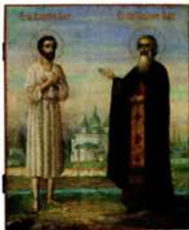
Блж. Прокопий и прп. Трифон Вятские. Икона. Кон. XIX — нач. XX в. (частное собрание)