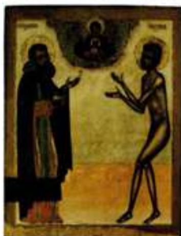
Прп. Трифон и блж. Прокопий Вятские. Икона. Кон. XVII — нач. XVIII в. (Вятский художественный музей им. В. М. и А. М. Васнецовых)

Единоличные иконы П. встречаются гораздо реже, датируются преимущественно кон. XIX — нач. XX в. Одна из них