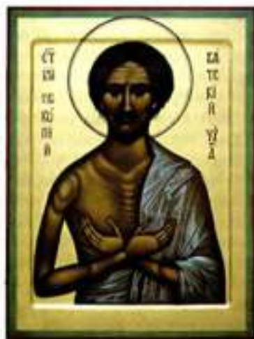
Блж. Прокопий Вятский.